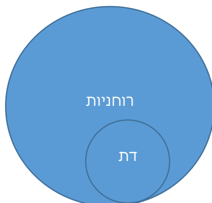
תרשים 3.1: הרוחניות כוללת את הדת ומטמיעה אותה

בהינתן הגדרות אלו, הרוחניות היא המקור לדת, אך היא אינה מוגבלת לדת. הרוחניות כוללת את הדת וגם מטמיעה אותה. (ראו תרשים 3.1).